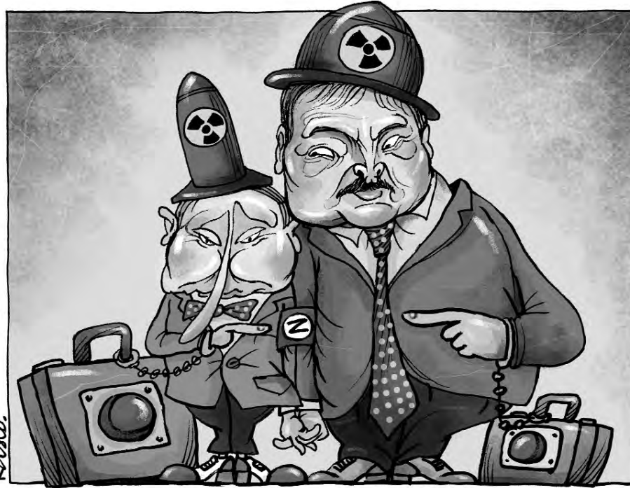
Товариші по «атому» — путін та лукашенко домовилися розгорнути частину тактичного ядерного арсеналу москви в білорусі.